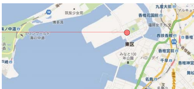
図-2 ヘリポート位置