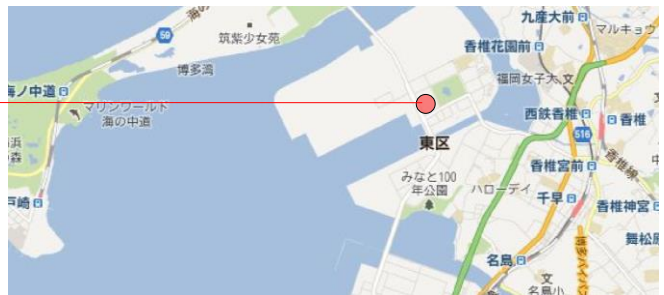
図-2 ヘリポート位置